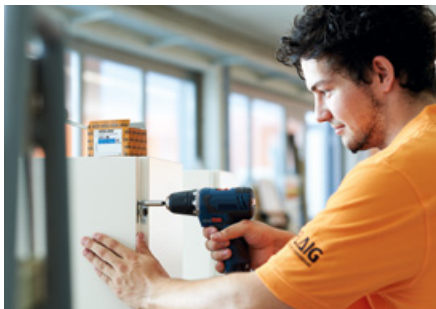
Stirnseitige Montagen von Beschlägen